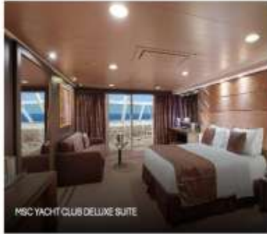
MSC YACHT CLUB DELUXE SUITE