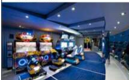
VIDEO GAMES ARCADE