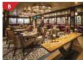
Bistro By Mark Best Relish contemporary Western cuisine from the internationally-acclaimed Australian chef.