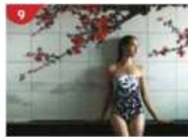
Crystal Life™ Spa Rejuvenate mind, body and soul with our holistic Western and Asian spa experience.