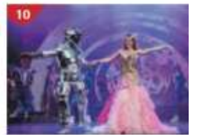
Zodiac Theatre Enjoy live production shows from the acclaimed award-winning entertainment team.