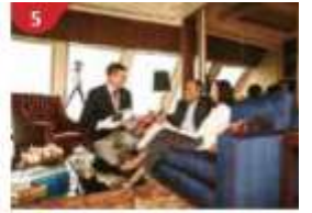
The Palace Indulge in European-style butler service and exclusive facilities.