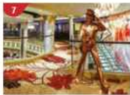
Johnnie Walker House™ Immerse yourself in the intricate world of premium Scotch whisky.