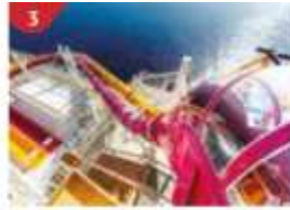
Waterslide Park Get drenched in fun on one of our six different waterslides.