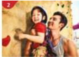
Rock Climbing Wall Challenge yourself on our mountainous rock climbing wall.