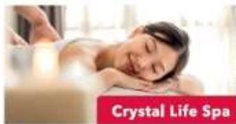
Crystal Life Spa