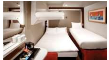
พัก 3-4 ท่าน