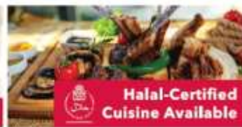
Halal-Certified Cuisine Available