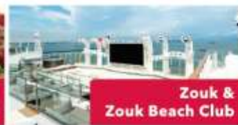
Zouk & Zouk Beach Club