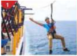
Ropes Course & Zipline Feel the thrill of gliding above the ocean on a 35-metre zipline.

ถ้าท่านประสงค์จะถือกระเป่าเดินทางลงด้วยตัวเองไม่จำเป็นต้องวางไว้ที่หน้าห้องพัก