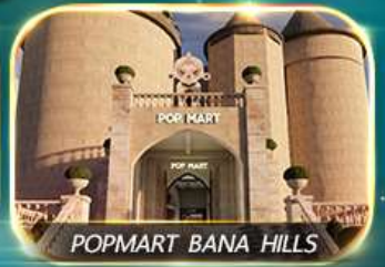
POPMART BANA HILLS

สัมผัสความงามหมู่บ้านฝรั่งเศสที่บานาฮิลล์ ช้อปปิ้ง POPMART