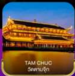
TAM CHUC วัดตามจิก