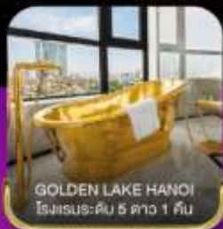
GOLDEN LAKE HANOI โรงแรมระดับ 5 ดาว 1 คืน