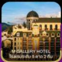
M GALLERY HOTEL โรงแรมระดับ 5 ดาว 2 คืน