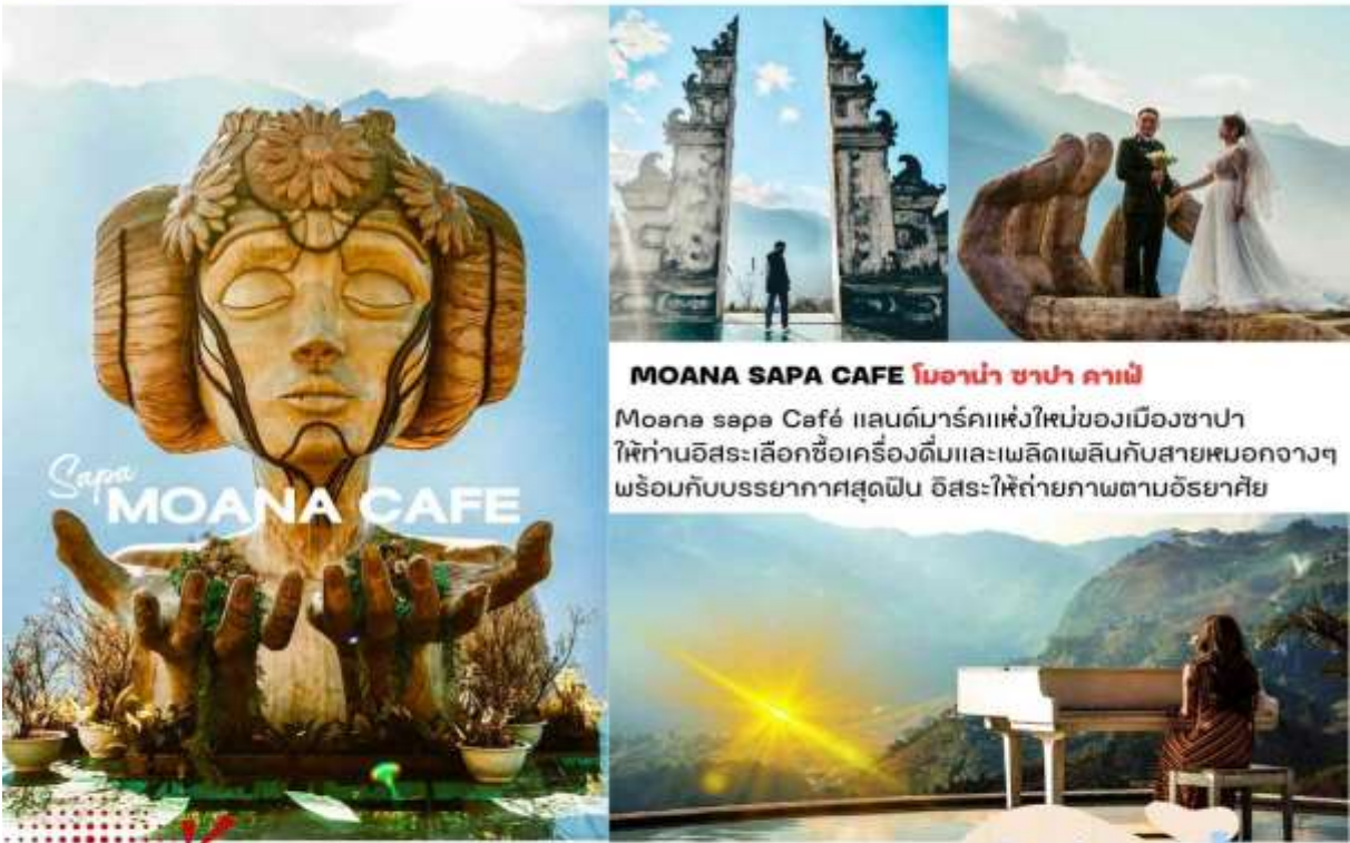
MOANA SAPA CAFE โมนาซ่า ซาปา คาเฟ่ Moana sapa Café แลนด์มาร์คแห่งใหม่ของเมืองซาปา ให้ท่านอิสระเลือกซื้อเครื่องดื่มและเพลิดเพลินกับสายหมอกจางๆ พร้อมกับบรรยากาศสุดฟิน อิสระให้ถ่ายภาพตามอัธยาศัย