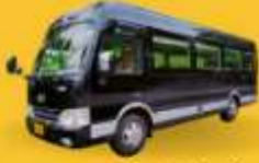
BUS (10-18 ท่าน)