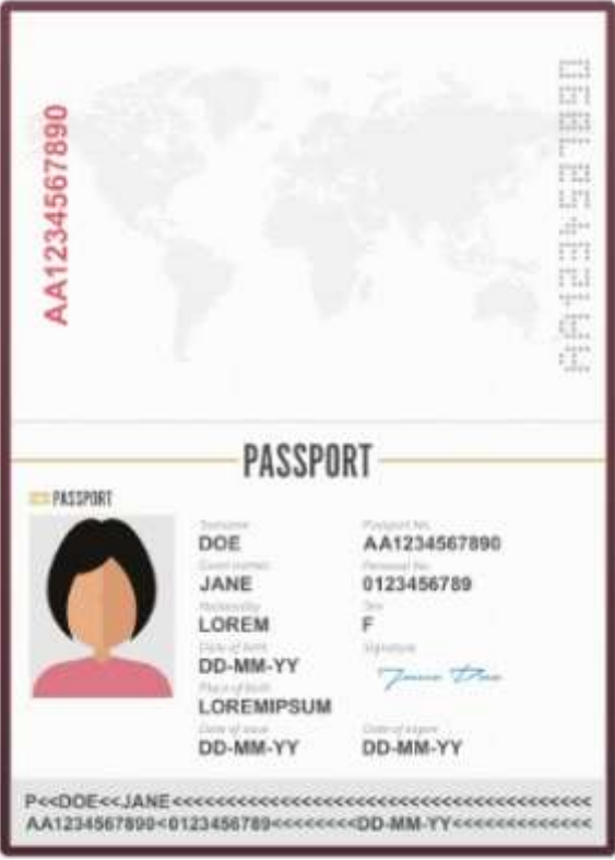
รูปถ่ายหน้าพาสปอร์ต