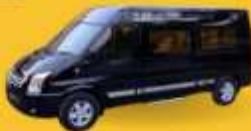
VAN (7-8 ท่าน)