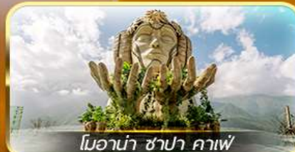
โมนาน่า ซาปา คาเฟ่