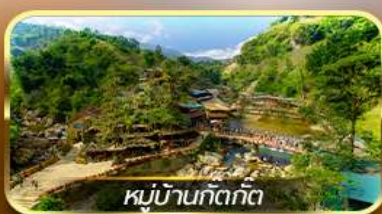
หมู่บ้านก๊อดก๊อด