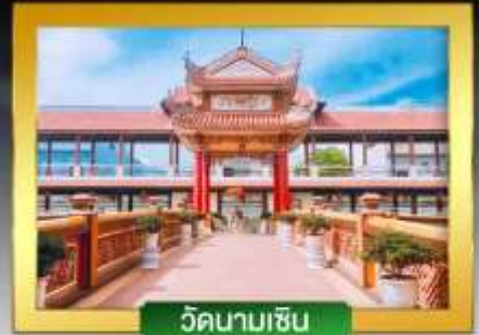
วัดนามเซิน