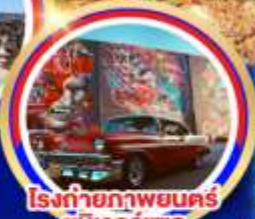
โรงถ่ายภาพยนตร์ ยูนิเวอร์แซล