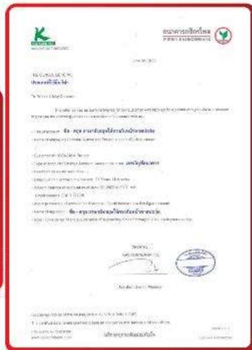
ตัวอย่าง Bank Guarantee ที่ผู้สมัครต้องยื่นขอ