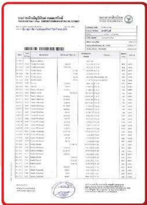
ตัวอย่าง Bank Statement ที่ผู้สมัครต้องยื่นขอ