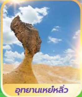
อุทยานเขยฺหฺลิว