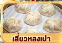
เสี้ยวหลงเปา