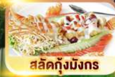
สลัดกุ้งมังกร