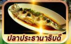
ปลาประรานาธิบดี