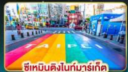
ซีเหมินติงไนท์มาร์เก็ต