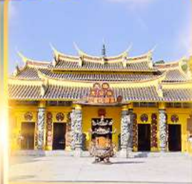
วัดซอพรเทพเจ้า