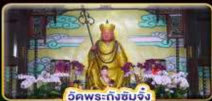
วัดพระถังซำจั๋ง

"ล่องเรือทะเลสาบสุริยันจันทรา" ขอความรักวัดหลงซาน