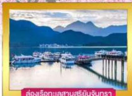
ล่องเรือทะเลสาบสุริยันจันทรา