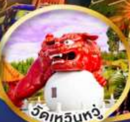
วัดเหวินทง