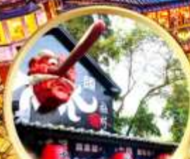
หมู่บ้านปี้ศาจชิวโกว