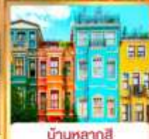
บ้านหลากสี คิสเลอร์ฟูล