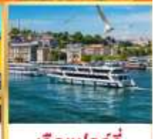
เรือเฟอร์รี่

เที่ยวครบเส้นทางยอดนิยม บินเข้าถึงเย็น เช้าชมสุเหร่ายักษ์คามลิก้า และล่องเรือเฟอร์รี่ ชมเทศกาลทิวลิปแห่งนครฮิสตันบูล