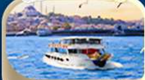
ช่องแคบบอสฟอรัส

📅 19-27 มี.ค.68 / 4-12 เม.ย.68 / 6-14 เม.ย.68 13-21 เม.ย.68 / 19-27 เม.ย.68 / 3-11 พ.ค.68