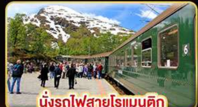
นั่งรถไฟสายโรแมนติก “พร้อมสปาณา”