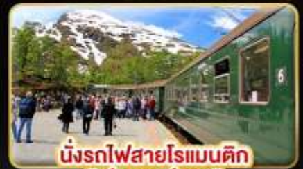
นั่งรถไฟสายโรแมนติก “ฟรอมสปาน่า”