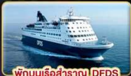
พักบนเรือสำราญ DFDS