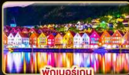
พักเบอร์เกน