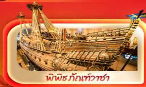
พิพิธภัณฑ์ท้าวชา