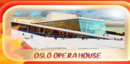
OSLO OPERA HOUSE