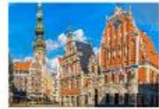
เมืองริกา

** พักที่ Bellevue Park Hotel Riga 4* หรือเทียบเท่า **