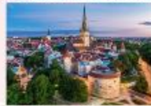
Tallinn Old Town