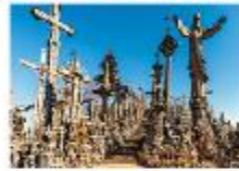
Hill of Crosses