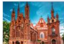
โบสถ์เซนต์แอน