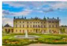
พระราชวัง Branicki