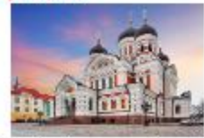
โบสถ์อเล็กซานเดอร์ เนฟสกี

19.35 น. ออกเดินทางสู่อิสตันบูล เที่ยวบิน TK1424