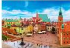
จัตุรัสเมืองเก่า