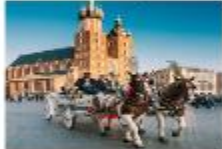
Krakow Old Town

05.15 น. เดินทางถึงสนามบินอิสตันบูล แวะเปลี่ยนเครื่อง 07.25 น. ออกเดินทางสู่สนามบินคราคูฟ เที่ยวบิน TK1271 08.45 น. เดินทางถึงสนามบินคราคูฟ ประเทศโปแลนด์