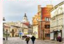
Kaunas Old Town

** พักที่ Holiday Inn Vilnius Hotel 4* หรือเทียบเท่า **