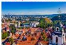
Vilnius Old Town