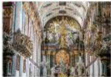
อารามจัสนา โกรา

** พักที่ Mercure Centrum Hotel 4* หรือเทียบเท่า **