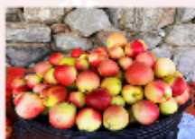
สวนผลไม้ตามฤดูกาล