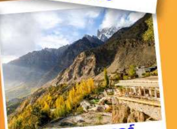
ยอดเขาดยูเกอร์