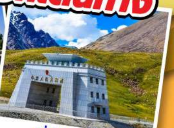
ตำนคุณจิราบ