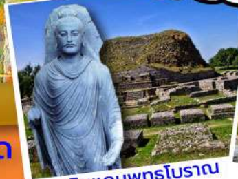
ดินแดนพุทธโบราณ ตักศิลา