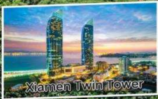
Xiamen Twin Tower