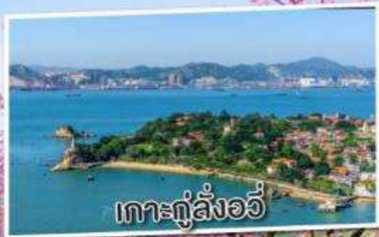
เกาะกู่ลิ่งอวี่