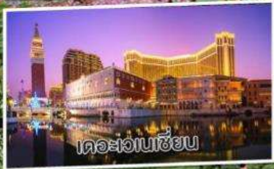
เดอะเวเนเซียน