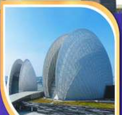
โรงละครหอยโขงบุก