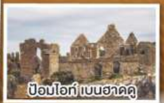
ป้อมไอ้ก่ เบนฮาคดู