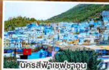
นครสีฟ้าเซฟซาอูน