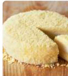
ร้าน LeTAO ร้านมีสินค้าหลากหลายด้วยบรรยากาศที่ ร้านตกแต่งสวยงามให้ที่สบายใจ ชิมเค้ก ด้วยนมจืดจากนมวัวสดปิ้งที่