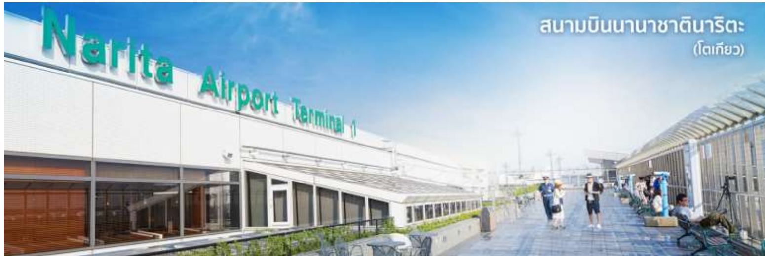
สนามบินนานาชาตินาริตะ (โตเกียว)

10.55 น. เดินทางถึง ท่าอากาศยานนานาชาตินาริตะ ประเทศญี่ปุ่น (เวลาที่ประเทศญี่ปุ่นจะเร็วกว่าประเทศไทย 2 ชม.ควรปรับนาฬิกาของท่านเพื่อสะดวกในการนัดหมาย) นำท่านผ่านขั้นตอนการตรวจคนเข้าเมืองและศุลกากร พร้อม ตรวจเช็คสัมภาระ เรียบร้อยแล้ว สำคัญมาก!! ประเทศญี่ปุ่นไม่อนุญาตให้นำอาหารสด เนื้อสัตว์ พืช ผัก ผลไม้ เข้าประเทศ หากฝ่าฝืนมีโทษปรับและจับ