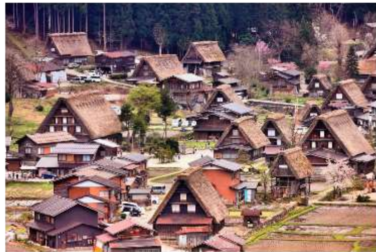
รูปใช้เพื่อประกอบการโฆษณาเท่านั้น