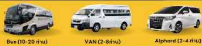
Bus (10-20 ท่าน)

สำหรับท่านที่ต้องการความเป็นส่วนตัวมากขึ้น ท่านสามารถเลือกใช้บริการ รถส่วนตัวได้ โดยมีรูปแบบรถให้เลือกถึง 3 ประเภท โดยรถ แต่ละประเภท สามารถนั่งได้ตั้งแต่ 2 ท่านขึ้นไป