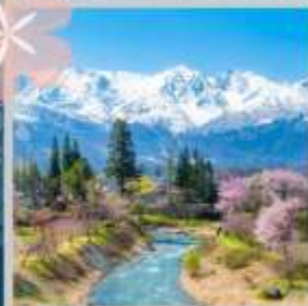
"HAKUBA OIDE PARK"