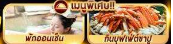
พักออนเซ็น