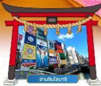
ย่านชินโซนาชิ