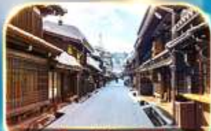
เมืองท่าชินมาชิซูจิ