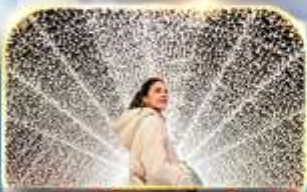
ชมงานประดับไฟนาฮานา โมะ ซาโตะ