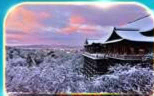
วัดคิโยมิตสึ