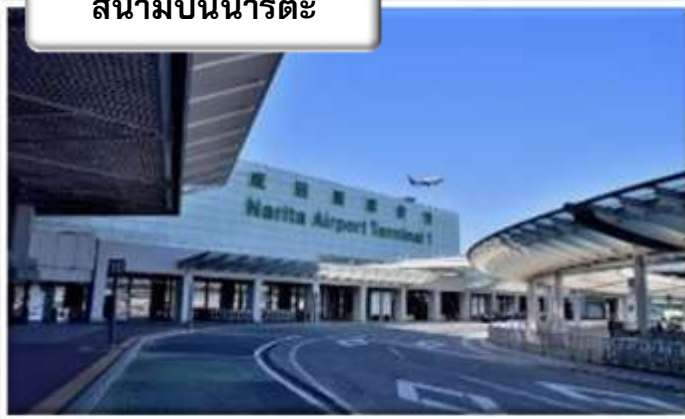
สนามบินนาริตะ

เวลา 08.00 น. เดินทางถึง สนามบินนาริตะ ประเทศญี่ปุ่น นำท่านผ่านขั้นตอนการตรวจคนเข้าเมืองและศุลกากร