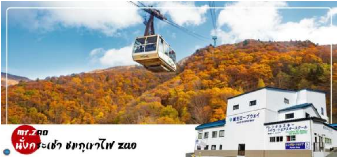
mt. ZAO นั่งกระเช้า ชมภูเขาไฟ zao

วันที่สาม เมืองฟุกุชิมะ – ซาโอะ – ภูเขาไฟซาโอะ (นั่งกระเช้า) – เมืองยามากาตะ – กินชัง ออนเซ็น – เมืองเซนได – ถนนคิลิโรรัด