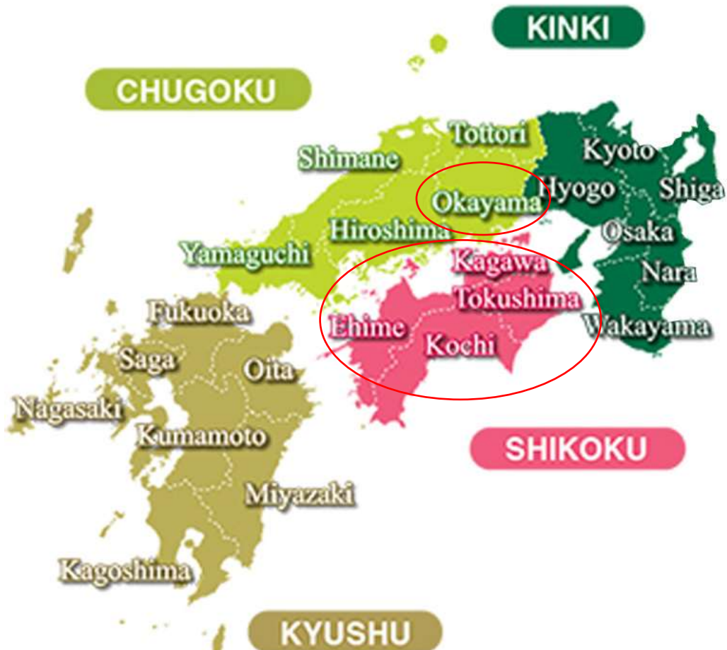
จังหวัด คางาวะ (KAGAWA) ตั้งอยู่บนเกาะชิโกกุ (SHIKOKU) 1 ใน 4 เกาะหลักของญี่ปุ่น