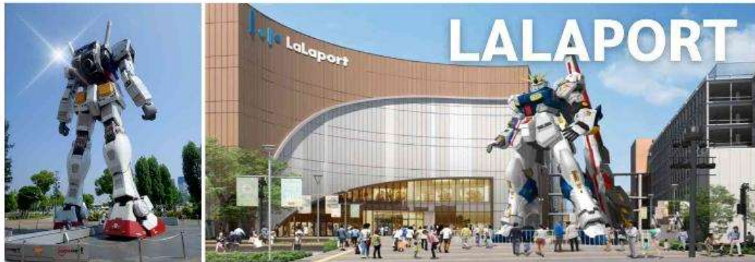
กันดั้มแห่่งฟูโกะ ตั้งอยู่หน้าบริเวณห้าง Mitsui Shopping Park LaLaport Fukuoka กันดั้มตัวนี้คือ "RX-93ffv Gundam" ตัวใหม่ล่าสุด ให้ท่านถ่ายภาพตามอัธยาศัย

OUTLET ตั้งอยู่ที่เมืองซากะ เป็นแหล่งช้อปปิ้ง เอาท์เล็ตครบวงจร ให้ทุกท่านช้อปปิ้งกันอย่างสะดวกสบาย โดยมีสินค้าให้เลือกหลากหลาย ตั้งแต่ระดับพรีเมียมจนไปถึงทั่วๆไป ซึ่งจะมีร้านค้าของแบรนด์ชั้นนำและแบรนด์ท้องถิ่นมากกว่า 150 ร้าน พร้อมโปรโมชั่นตลอดทั้งปี เช่น เสื้อผ้า รองเท้า กระเป๋า เครื่องสำอาง อย่าง Coach, Armani, Timberland, Burberry, Gap, Puma, Levi's, Nike, New Balance, Samsonite และอื่นๆ อีกมากมาย