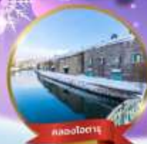
คลองไอตารุ