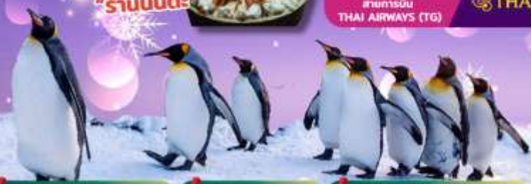
พักโทมามุสกีรีสอร์ท 2 คืน