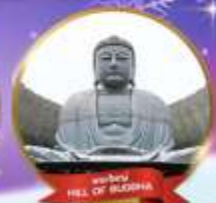
พระใหญ่ HILL OF BUDDHA