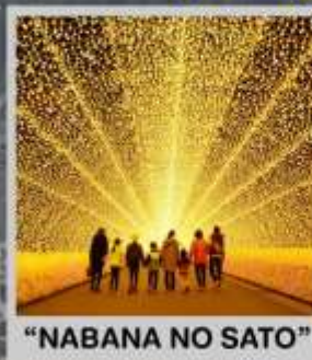
"NABANA NO SATO"