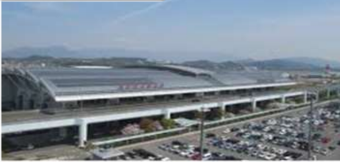
สนามบินฟุกุโอกะ

เวลา 00.50 น. ออกเดินทางสู่ สนามบินฟุกุโอกะ ประเทศญี่ปุ่น โดยสายการบินไทย เที่ยวบินที่