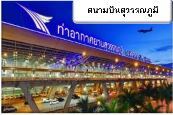
สนามบินสุวรรณภูมิ

เวลา 22.00 น. พร้อมกันที่ ท่าอากาศยานสุวรรณภูมิ อาคารผู้โดยสารขาออกระหว่างประเทศ เคาน์เตอร์ สายการบินไทย เจ้าหน้าที่คอยให้การต้อนรับ ดูแลด้าน เอกสาร เช็คอิน และสัมภาระในการเดินทาง