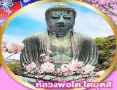
หลวงพ่อดำ โคโคคุจิน