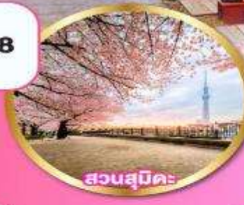
สวนสุมิดะ

หลวงพ่อดำ" แห่งวัดโคโคคุจิน ชมซากุระ: ริมทะเลสาบคาวาคุจิโกะ ชมซากุระ: ณ สวนสุมิดะ พร้อมวิวโตเกียวสกายทรี บุฟเฟ่ต์ญี่ปุ่น 5 รับประทานอาหาร 1 วันเต็มในโตเกียว