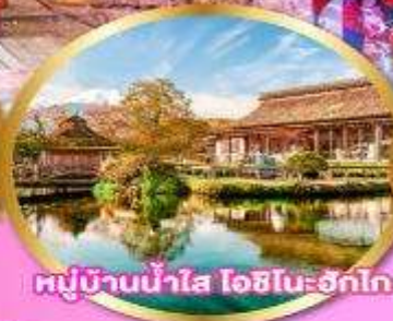
หมู่บ้านน้ำใส โอชิโนะฮักโก