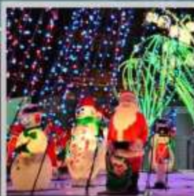
"ODORI GERMAN CHRISTMAS"