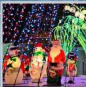
"ODORI GERMAN CHRISTMAS"