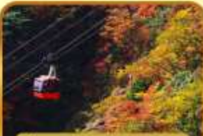
นั่งกระเช้าภูเขาโทโฮไซ