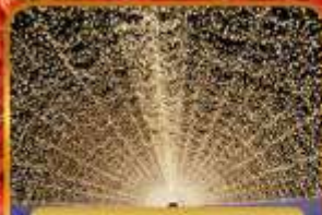
บาระบะโนะซาโตะ