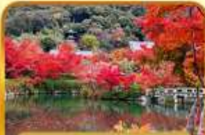
วัดเออิทังโต