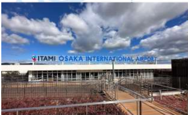
TRNF TO ITAMI AIRPORT/FLY TO YAMAGATA AIRPORT

เดินทางสู่ "สนามบินอิตามิ" ออกเดินทางสู่ "สนามบินยามางาตะ" โดยสายการบินเจแปนแอร์ไลน์ เที่ยวบินที่ JL 2237 (15.50 น.-17.00 น.)