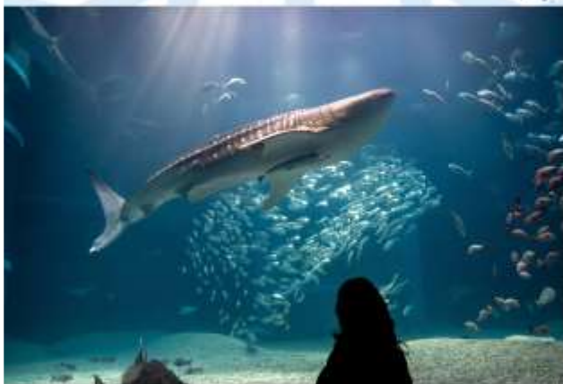
VISIT KAIYUKAN AQUARIUM

เดินทางสู่ "นครโอซาก้า" เมืองแห่งรอยยิ้มและอาหารอร่อยเต็มไปด้วยชีวิตชีวาและวัฒนธรรมอันเป็นเอกลักษณ์ของญี่ปุ่น ตั้งอยู่บนเกาะฮอนชู เป็นเมืองที่มีขนาดเศรษฐกิจใหญ่เป็นอันดับ 2 และมีประชากรมากเป็นอันดับ 3 ของประเทศ