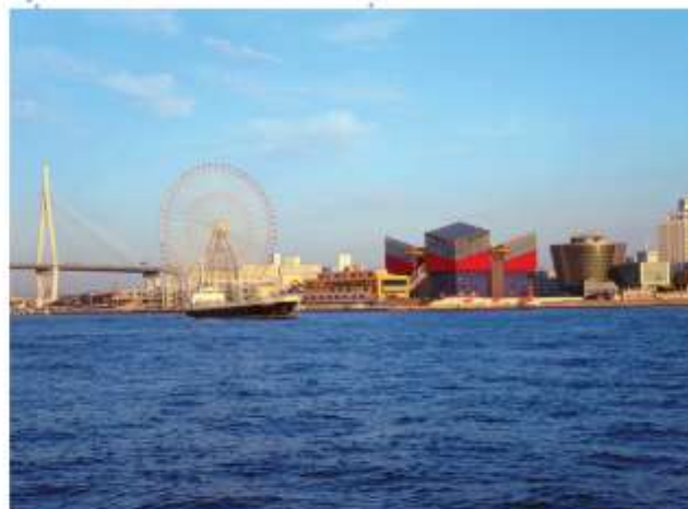
VISIT TEMPOZAN MARKET PLACE