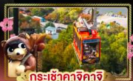
กระเช้าคาจิกาจิ