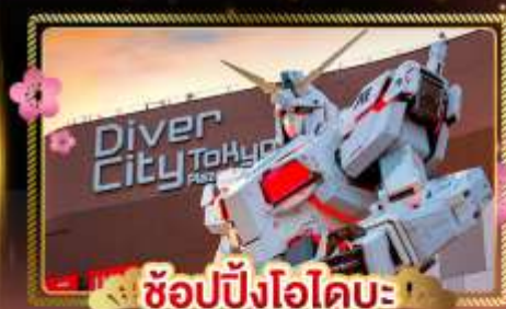
ช้อปปิ้งไอโดบะ

🍽️ สายการบิน Full service พร้อมอาหารบนเครื่อง