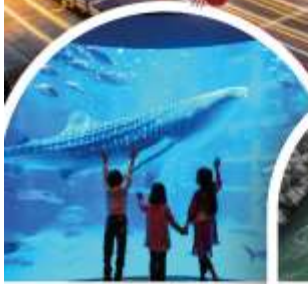
พิพิธภัณฑ์สัตว์น้ำโคคุยกัง