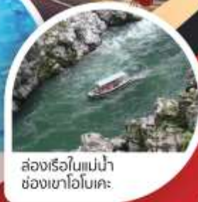
ล่องเรือใบแม่น้ำช่องเขาโอโมเตะ

นารุโตะ ◦ โคโตะ ◦ โดโกะ ◦ อะฮิเมะ ◦ โอซาก้า