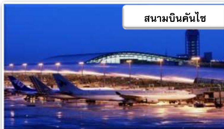
สนามบินคันไซ

บริการอาหารร้อนบนเครื่องพร้อมกับเมนูขนมหวานเพื่อเติมเต็มความพิเศษไปพร้อมๆกับความสดชื่น