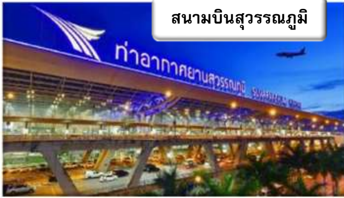
สนามบินสุวรรณภูมิ

เวลา 21.00 น. พร้อมกันที่ ท่าอากาศยานสุวรรณภูมิ อาคารผู้โดยสารขาออกระหว่างประเทศ เคาน์เตอร์สายการบินเจแปนแอร์ไลน์ เจ้าหน้าที่คอยให้การต้อนรับ ดูแลด้านเอกสาร เช็คอิน และสัมภาระในการเดินทาง